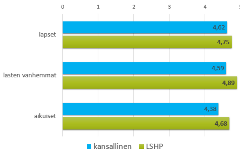
Asiakaskokemuksen keskiarvot viikon 36 (Q3/22) kyselyssä

Viikolla 36 (Q3/22) toteutetun kyselyn perusteella saimme korkeat asiakaskokemus- ja suosittelepisteet valtakunnallisestikin verrattuna. Kiitämme saaduista vastauksista.