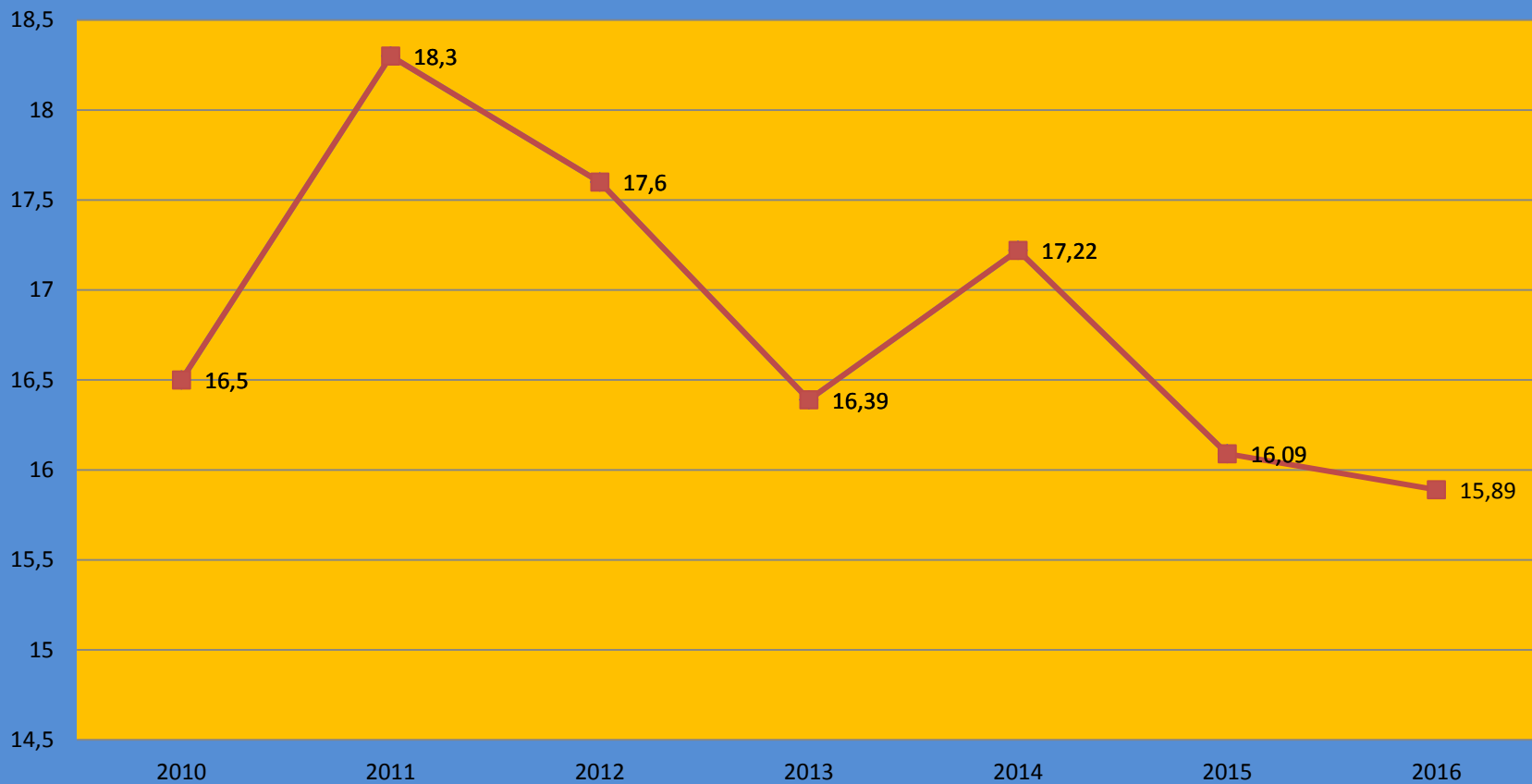
Sairauspoissaolopäiviä /htv 2010-2016