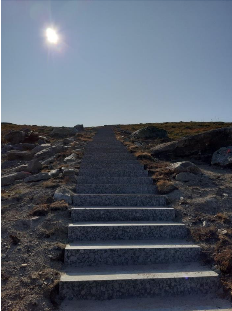
Saana-tunturin uudet rappuset